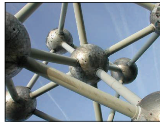
l'Atomium, Bruxelles

lles allemands, anglais, bulgare, danois, français, espagnol, italiens, polonais, tchèque sont en ce moment même en formation et peuvent échanger au travers des forums européens prévus dans le cadre de la formation. Certains-nes d'entre eux ont choisi de participer au "parcours européen" proposé et se préparent donc à suivre une partie de leur formation dans une autre langue que leur langue maternelle, accompagnés-ées en cela par un-e formateur-trice de l'organisme accueillant. Déjà en perspective la version grecque et roumaine.