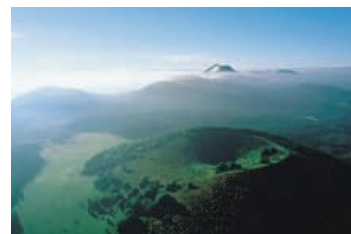
Vue aérienne du puy Pourcharet

Public averti, public d'initiés ? Les visiteurs du salon semblent apprécier les principaux avantages de la FOAD pour l'apprenant.