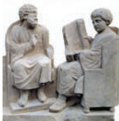
Maître et élève, (détail d'un bas-relief romain, musée de Trèves)

formation en ligne, des formateurs, des enseignants, des tuteurs, qui interviennent en FOAD ? Existe-t-il une différence significative entre évaluation présentielle et distancielle ?